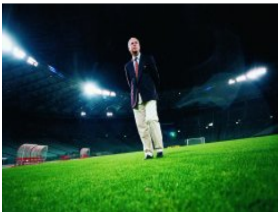
Abb. 4: Beckenbauer kurz nach dem Gewinn der Fußballweltmeisterschaft 1990 im Flutlicht des Stadion Olimpico in Rom

Mit einer eleganten Ballannahme Beckenbauers wird der profane, monotone Verlauf des Fußballspiels unterbrochen von einem außergewöhnlichen Ereignis – ein kurzes Aussetzen der profanen Zeit. Gleichsam ist mit Beckenbauer ein utopischer Zielpunkt formuliert – der ‚ideale‘ Fußball, der durch und bei ihm aufschien, ist die Verheißung, wie das Fußballspiel einst (idealerweise) aussehen könnte, ein ‚säkularisiertes Heilsversprechen‘, wenn man so will. Folgerichtig ist Beckenbauer denn auch Trainer geworden, hat als solcher 1990 die deutsche Nationalmannschaft zur Fußballweltmeisterschaft geführt und wird seither als „Lichtgestalt“ (WM-Rekordspieler 2006) bezeichnet. Inzwischen ist er auch als erfolgreicher Kommentator und Sportfunktionär tätig. Er ist Mittler, Bote und Mahner des reinen (Fußball-)Lichts.