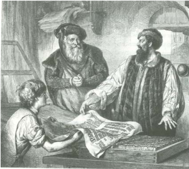
Abb. 5: Licht und Schatten der Erfindung

Die Aktivitäten Fusts und Schöffers hätten Gutenberg nicht nur ruiniert, sondern ihn auch um den Ruhm des Erfinders gebracht. Gutenberg wird dabei als tragischer Held und vergessenes Genie inszeniert, das den ihm zustehenden Ruhm zu Lebzeiten nicht erhielt. Genauso wird er bei der Einweihung des Gutenbergdenkmals in Mainz 1837 verstanden. Mit der Aufstellung des ersten Gutenberg-Denkmal sei „eine große Schuld getilgt“ (Gedenkbuch Mainz 1837, 1), wie es in einer der Gedenkschriften heißt. Der tragische Held wird hier als zu Unrecht vergessenes Genie inszeniert und als einzigartige Lichtgestalt gefeiert.