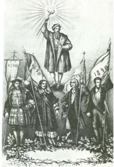
Abb. 7: Gutenberg als (nationaler) Schöpfer

Am Himmel thront eine von Licht umgebene Personifikation der Typographie; rechts daneben Merkur, der Götterbote, und links Minerva, Göttin der Weisheit. Das von oben herabfallende göttliche Licht trifft auf der Erde als erstes auf die links sitzende Germania, die Schilde mit Porträts von Gutenberg und Fust hält. Etwas tiefer sitzen die Personifikationen der anderen Nationen. Die Frage nach dem Herkunftsland des Buchdrucks scheint hier klar entschieden, und Gutenberg und Fust, als die zuerst vom göttlichen Licht Erfassten, sind die zentralen Erfinderfiguren.