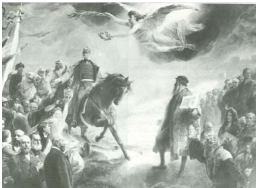
Abb. 8: Die Wiedergeburt der Kulturnation als Lichtspektakel