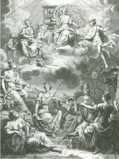
Abb. 6 Der Wettstreit der Nationen

allein die deutsche Nation hatte großes Interesse daran, die Erfindung für sich reklamieren zu können, weil sie sich damit als Kulturnation gegenüber Italien und Frankreich zu etablieren gedachte (Giesecke 1998, 192ff.). An einem Kupferstich aus dem Jahre 1740 lässt sich die nationale Bestrebung gut nachvollziehen (Abb. 6).