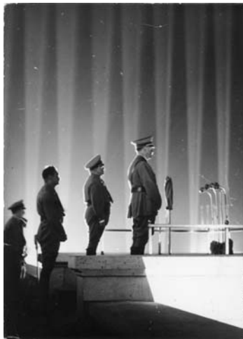
Abb. 3: Die ‚aufsteigende Lichtlinie zu Hitler‘ in einer Lichtdominanzszenierung Albert Speers

Verheißung eines revolutionären Endpunktes, etwa der Aufhebung aller Klassenunterschiede, verbunden werden (siehe Abb. 2). Auch ganz anders gelagerte politische, nationale Bestrebungen werden formal mit dem christlichen Lichtkonzept besetzt. Adolf Hitler zum Beispiel wird häufig als Lichtgestalt, die das ›Volk heim ins Reich holt‹, von Albert Speer in Szene gesetzt (siehe Abb. 3). Hitler steht hierbei für eine Zäsur, eine Absetzungsbewegung gegenüber dem Vorangegangenen, der profanen Zeit, für eine Neuschöpfung und das Versprechen einer utopischen, heilsgeschichtlichen Rückkehr in die ‚völkische Heimat‘. Pointierter formuliert: Es geht um das Aussetzen der profanen Zeit im ‚Tausendjährigen Reich‘ (Reichel 1991).